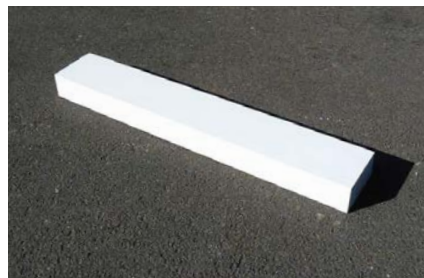
FA-5032 走り幅跳び・三段跳び用踏切板

日本陸上競技連盟検定品 (台) ¥648,000 / 税込¥712,800 •ステンレス製 •手カギ2個 •フタ付 •重量67kg