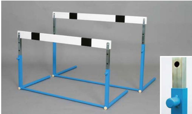
FA-1110 固定式ワンタッチハードル (小学校用)

(台) ¥12,000 / 税込¥13,200 •材質/支柱: スチール、バー: 木製 •重量/4kg •W1,000×D493mm •H/440、520、600、680mm (4段式)