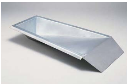
FA-5033 棒高跳び用穴箱(クレートラック用)

(台) ¥13,500 / 税込¥14,850 •材質/支柱: スチール、バー: 木製 •重量/4.7kg •W1,100×D530mm •H/600、680、762、838、914mm (5段式)