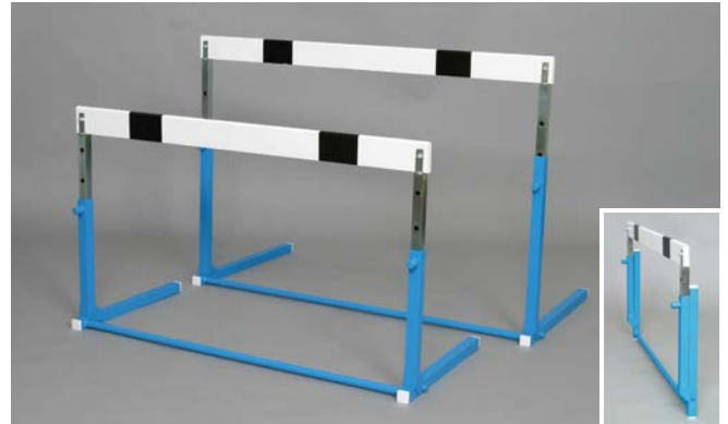
FA-1130 折畳式ワンタッチハードル (小学校用)

(台) ¥13,000 / 税込¥14,300 •材質/支柱: スチール、バー: 木製 •重量/5kg •W1,100×D493mm •H/600、680、762、838、914mm (5段式)