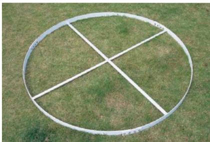
FA-7082 円盤投げ用サークル

日本陸上競技連盟検定品 (基) ¥45,000 / 税込¥49,500 •木製 •W1,220×D114×厚80mm •重量4.5kg