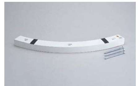
FA-7042 砲丸投げ用足留材

日本陸上競技連盟検定品 (台) ¥40,000 / 税込¥44,000 •W1,220×D200×厚100mm •重量14kg