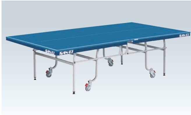
PS-1266 卓球台<内折式>(学校推奨)

国際卓球連盟公認品 日本卓球協会検定品 (台)¥300,000 ●W1,525×D2,740×H760mm ●スーパープライコア天板・特殊シルクスクリーン仕上 ●厚25mm、50mm枠付 ●重量≒117kg ●ネット、サポート(別途)