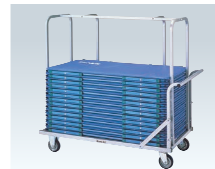
卓球用防球柵運搬車

PS-6036 (台)¥82,000 ●幅1,400mm積用 ●重量≒50kg ●40台積