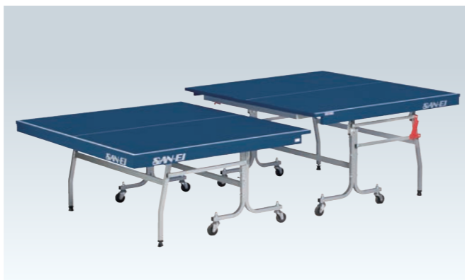
PS-3442 卓球台<高低調節式>(特殊台)

日本卓球協会検定品 (台)¥85,000 ●W1,525×D2,740×H760mm ●メラミン化粧張パーティクルボード・特殊シルクスクリーン仕上 ●厚18mm、40mm枠付 ●重量≒101kg ●ネット、サポート(別途)