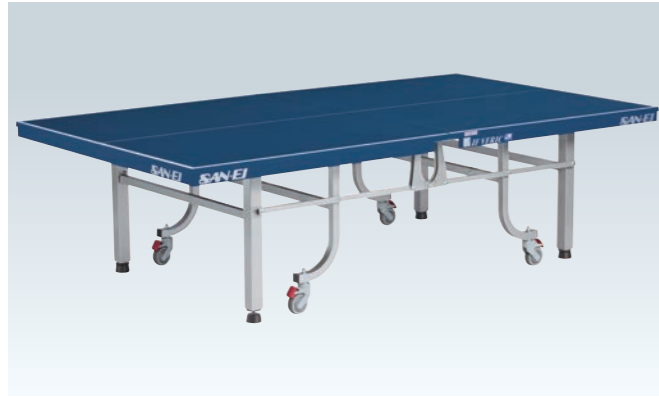
PS-1265 卓球台<内折式>(体育館推奨)

国際卓球連盟公認品 日本卓球協会検定品 (台)¥300,000 ●W1,525×D2,740×H760mm ●スーパープライコア天板・特殊シルクスクリーン仕上 ●厚25mm、50mm枠付 ●重量≒117kg ●ネット、サポート(別途)