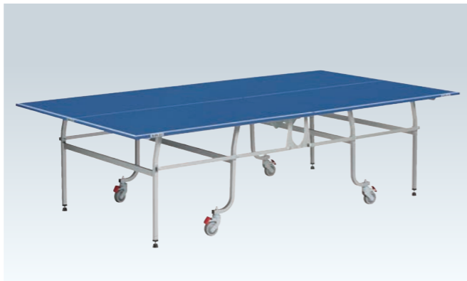
PS-1267 卓球台<内折式>(個人推奨)

日本卓球協会検定品 (台)¥140,000 ●W1,525×D2,740×H760mm ●特殊パーティクルボード・特殊シルクスクリーン仕上 ●厚22mm、40mm枠付 ●重量≒105kg ●ネット、サポート(別途)