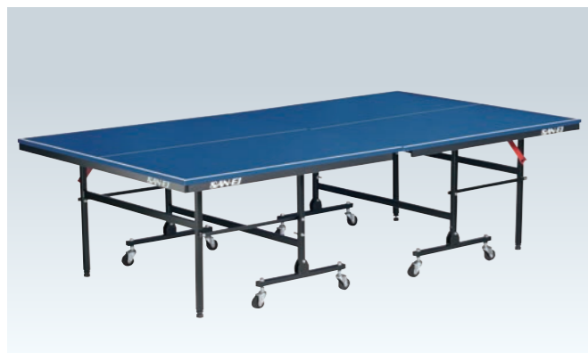
PS-2276 卓球台<セパレート>(個人推奨)

(台)¥110,000 ●W1,525×D2,740×H760mm ●メラミン化粧張パーティクルボード・特殊シルクスクリーン仕上 ●厚18mm ●重量≒89kg ●ネット、サポート(別途)